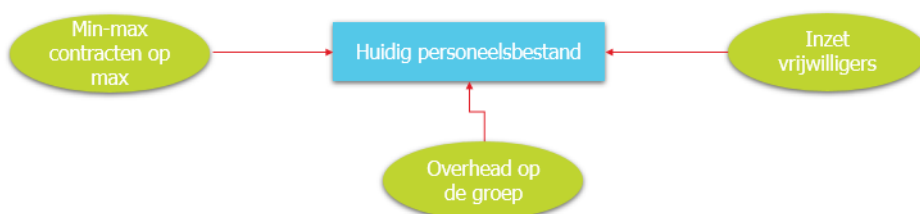
Figuur 5: oplossingen in het primair proces

Een mogelijkheid die wordt genoemd door zowel organisaties als or-leden is het inzetten van groepshulpen, waardoor pm'ers meer tijd vrij spelen voor het werken op de groep.