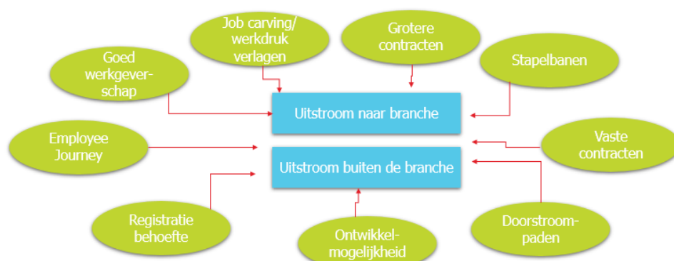
Figuur 4: activiteiten gericht op behoud van medewerkers (beperken uitstroom)

De genoemde oplossingen zijn getoond in onderstaande figuur.