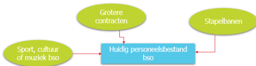
Figuur 6: oplossingen voor de bso