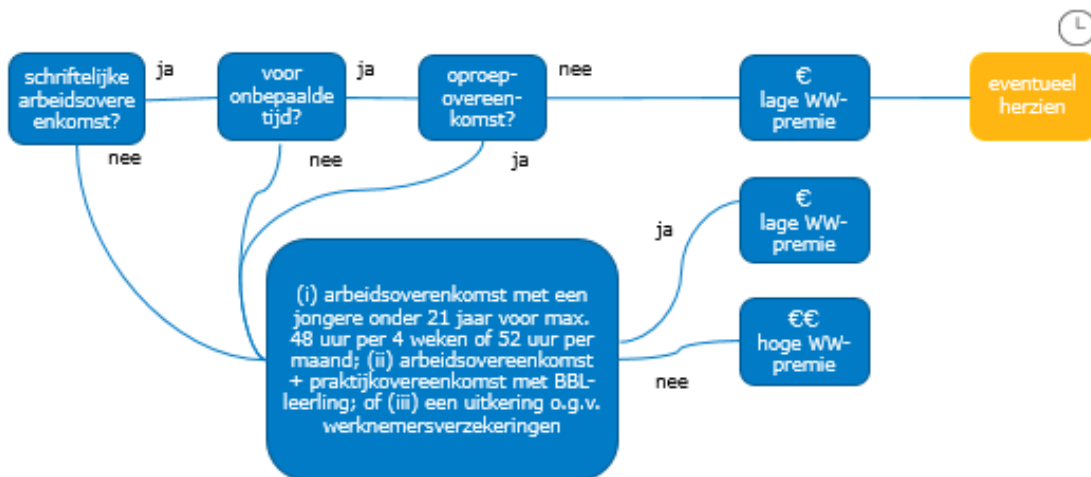
Figuur 1: hoge/lage WW-premie