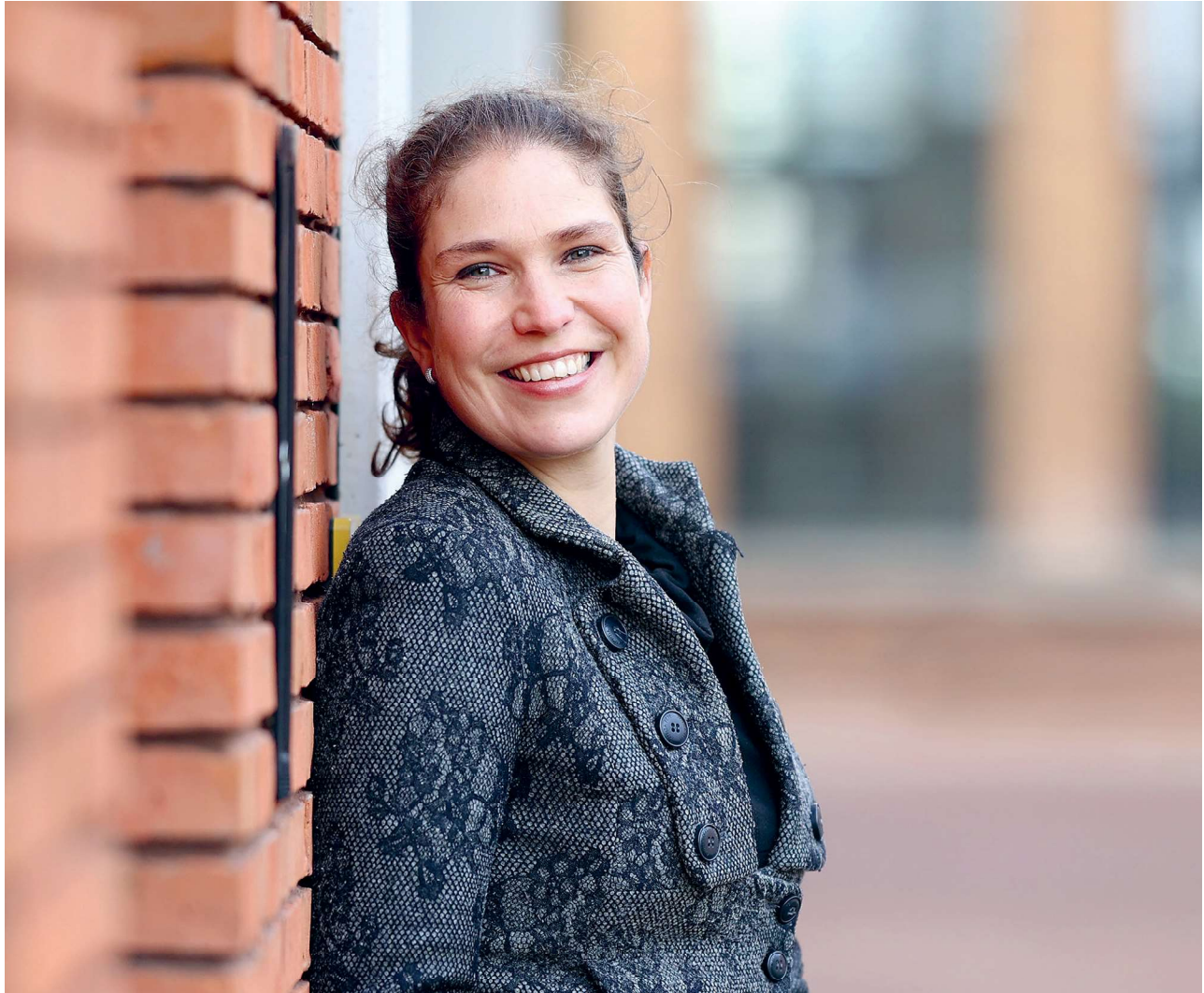
‘Het voelt als onrecht dat kinderen die wel naar de opvang en bso gaan, twee keer zo veel ontwikkeltijd krijgen als kinderen die geen toegang tot opvang hebben.’